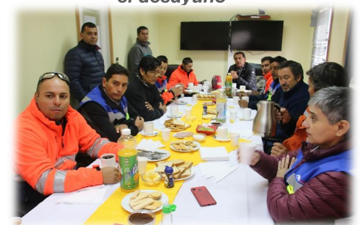
La importancia de la Familia AVA