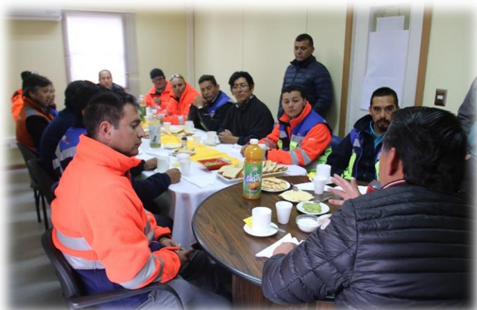
Trabajadores compartiendo desayuno