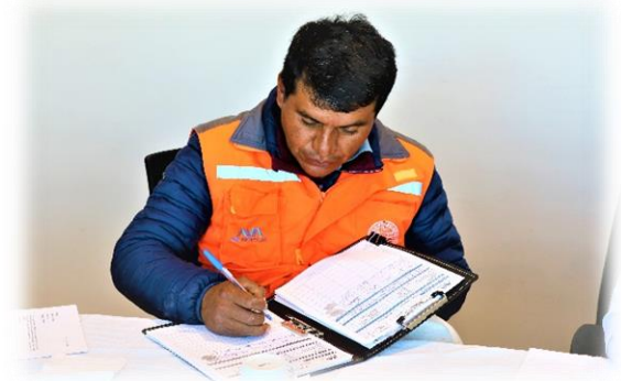
Firma de acta de conformación de COMITÉ BIPARTITO